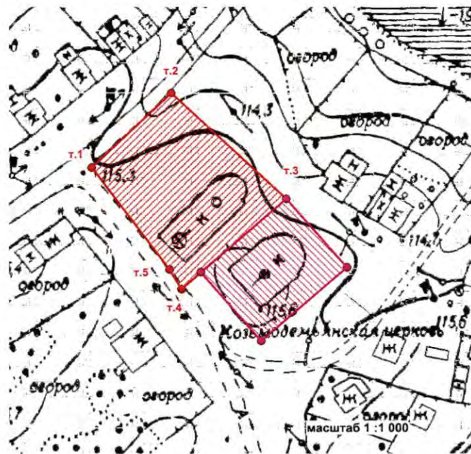
Карта (схема) границы территории объекта культурного наследия регионального значения Козьмодемьянская церковь с колокольней, XVIII в. г.Суздаль, ул.Коровники